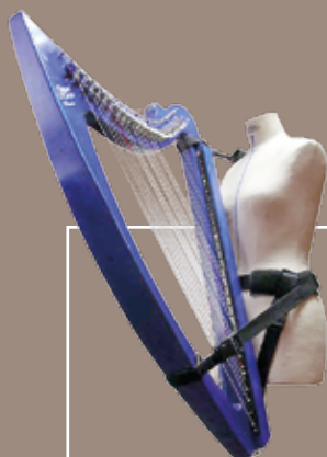
Harnais pour DHC 32 Harness for DHC 32