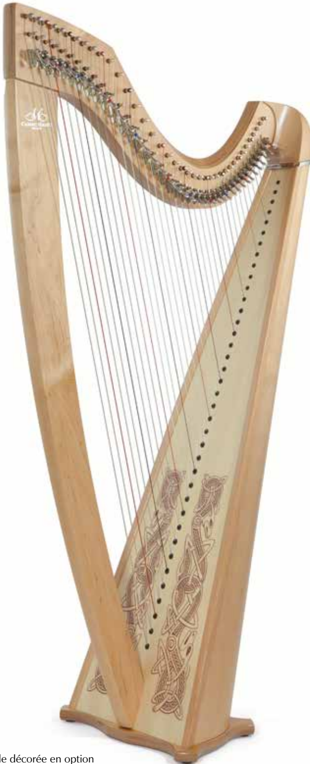
Table décorée en option Decorated soundboard (optional)