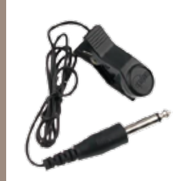
Capteur à pince Tranducer for tuner