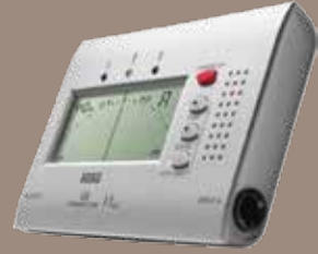
Accordeur électronique Korg CA Electronic tuner Korg CA