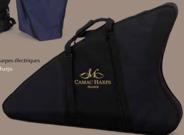
Housse de transport pour harpes électriques Transport cover for Electro-harps