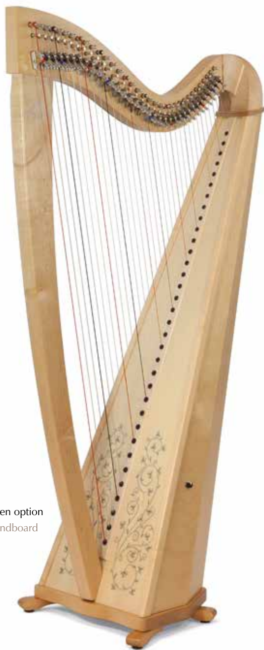
Table décorée en option Decorated soundboard (optional)

Bois utilisés : érable pour le corps, épicéa pour la table d'harmonie Finition : érable naturel