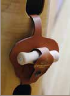
Porte clé en cuir Leather holster for tuning key