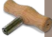
Clé d'accord Tuning key